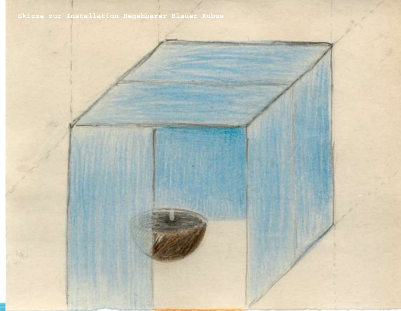
Skizze zur Installation Begehbarer Blauer Kubus

Der eine, der Raum der Geschichten die passieren. Der andere: Leitos, unberührt von allen Geschichten. Und der eine im dem anderen und der andere im dem einen.